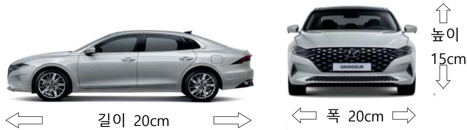
<로봇 사이즈 규정>